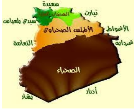
خريطة توضح مناطق ولاية البيض

كونها أكبر منطقة ممثلة من ارتفاعات الأطلس الصحراوي وكذا هذه المنطقة السطحية الصحراوية كما يتقلص العلو اتجاه الجنوب بين 100 إلى 500م. 1